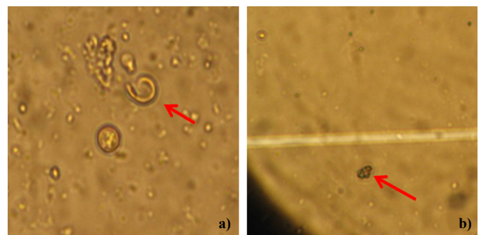
Figura 2. Dos de los efectos ejercidos por los preparados minerales sobre esporas de M. royeri . a) Degradación de la pared celular, causada por el SSC a las 48 h.; y b) Espora deshidratada, 48 h después de su exposición al tratamiento CBP.

About the mechanisms of action of mineral preparations on the pathogen, complementary to the inhibition of sporulation and mycelial formation that was observed in the agar diffusion test, during the liquid medium test it was possible to observe inhibition of spore germination and death caused by the breaking of cell walls (Figure 2a) and/or dehydration (Figure 2b). In vitro and field level have been documented the same effects on different phytopathogenic for various elements and compounds that compose the six mineral preparations: Sodium bicarbonate (Yildirim et al. , 2002), sulfur (Khan and Kulshrestha, 1991; Williams et al. , 2002; Williams and Cooper, 2004), calcium polysulfide (Montag et al. , 2005; Holb and Schnabel, 2008; Ramirez et al. , 2011a) and copper sulfate (Mills et al. , 2004; Montag et al. , 2006), among others. Moreover, it is known that some of these minerals induce resistance in plants, which can reduce the incidence and severity of damage in the field. In the case of broth silicosulfocalcico, one of its components is vegetable ash containing variable amounts of silicon the induction of resistance by this element has been extensively documented in different crops (Cherif et al. , 1994; Fauteux et al. , 2005; Qin and Tian, 2005).